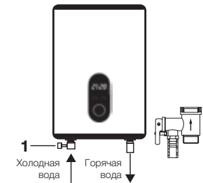
Рис. 1 1 Предохранительный сливной клапан.