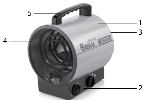
Рис. 1. Устройство прибора

Несущая конструкция тепловентилятора состоит из корпуса, изготовленного из листовой стали и имеющего цилиндрическую форму. В корпусе размещены вентилятор и трубчатые электронагревательные элементы. Снаружи корпуса расположен блок управления. Корпус, закрытый воздухозаборной и воздуховыпускной решетками, винтами устанавливается к корпусу блока управления. Вентилятор затягивает воздух через отверстия воздухозаборной решетки. Воздушный поток, втянутый вентилятором в корпус, проходя между петлями трубчатых электронагревательных элементов, нагревается и подается в помещение через отверстия воздуховыпускной решетки.